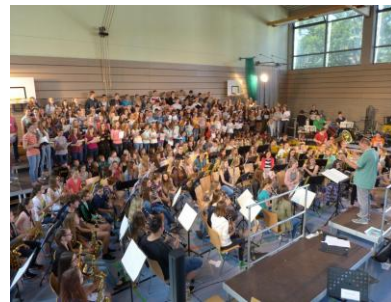
„Carmina Burana“ mit 300 Mitwirkenden