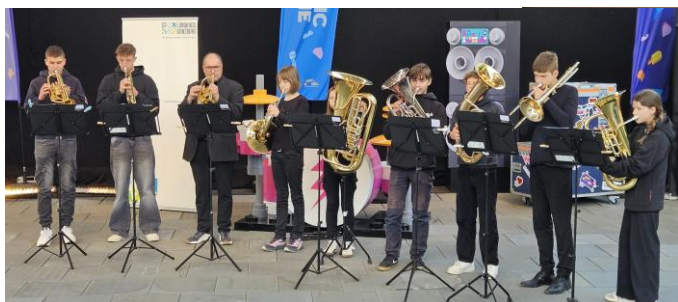
Fluthelfertag im Legoland (2025)

Mit dem Eintritt in die 12. Klasse endet der musische Zweig und alle Abiturfächer können ohne Einschränkung gewählt werden. Eine weitere Beteiligung an den Ensembles ist möglich. Durch die bisherige Schwerpunktlegung bietet sich Musik als Abiturfach oder Seminar besonders an. Außerdem können vokale und instrumentale Ensembles als „reguläres Fach“ gewählt und so in die Abiturnote eingebracht werden.