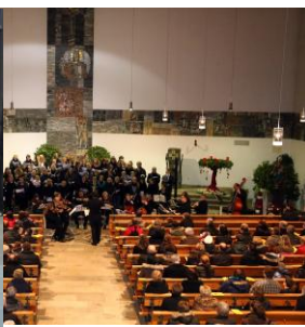
„Die Christnacht“ der Chorschule