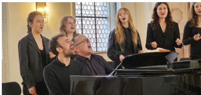
Konzert des Begabtenstützpunktes (2025)