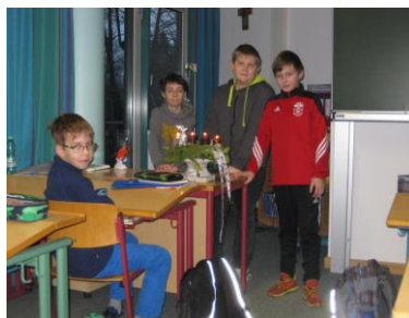
Vorbereitungen zum Morgenkreis