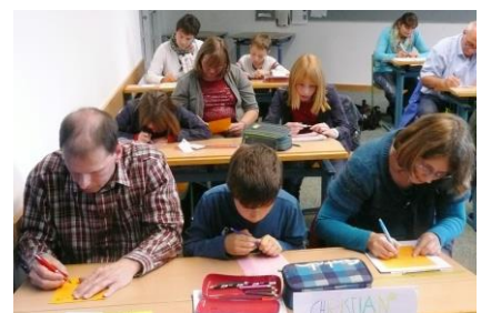
Lernseminar der 5. Klassen